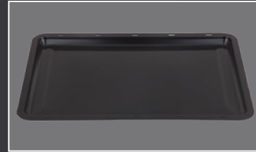
BANDEJA DE HORNO