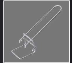
ASA DE BANDEJA