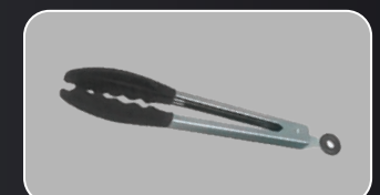
Pinza de nylon / Nylon tong / Pinça em nylon Pinça de nylon / Nylonzange / Pinza in nylon