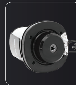
Engranaje de metal Metal gear