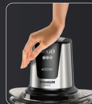
Botón de puesta en marcha On/off press button