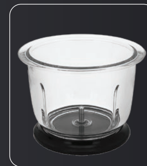
Recipiente de vidrio Glass bowl