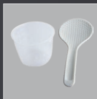
Measuring cup and Spoon Copo de medição e colher Misurino e cucchiaio