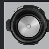
Inside the pot Dentro da panela Interno pentola