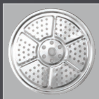
Bandeja para vapor 22 cm Plateau à vapeur 22 cm Dampfschale 22 cm