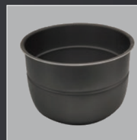
Aluminum pot Panela de alumínio Pentola di alluminio