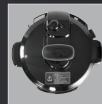
Lid Tampa Copertura