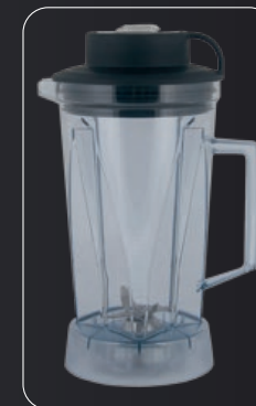
Jarra de 2L categoría alimenticia de la alta calidad de Copoliéster Tritan transparente sin BPA