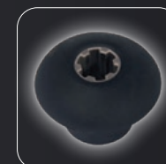
Embrague Fuerte: embrague de acero inoxidable duradero