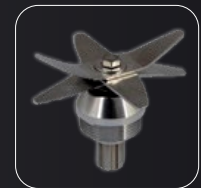
High quality stainless steel blade with 6 leaves