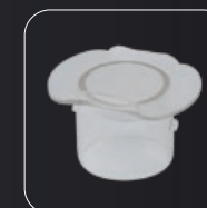
Tapa de plástico