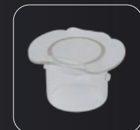
Little plastic cover