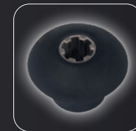
Strong clutch: Stainless steel clutch for durability