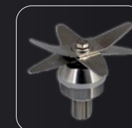
Hoja de acero inoxidable de larga vida con 6 hojas