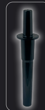
Barra de mezcla