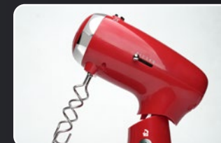
Ganchos de acero inoxidable para amasar Crochets pétrisseurs en acier inoxydable Edelstahl Taighaken