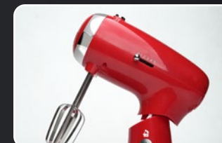
Varillas de acero inoxidable Batteurs en acier inoxydable Edelstahlklopfer