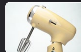
Varillas de acero inoxidable Batteurs en acier inoxydable Edelstahlklopfer