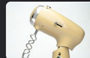
Stainless steel dough hook Ganchos de massa de aço inoxidável Ganci per impastare in acciaio inossidabile