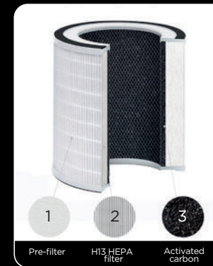
1 Pre-filter 2 H13 HEPA filter 3 Activated carbon