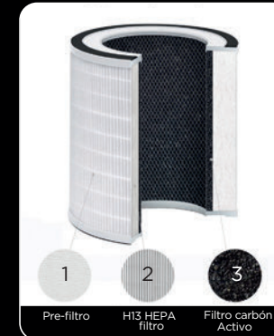
1 Pre-filtro 2 H13 HEPA filtro 3 Filtro carbón Activo