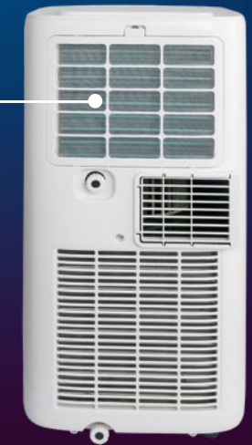
Filtro purificador Purifier Filter