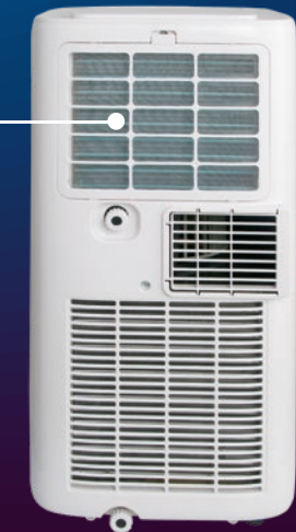
Filtro purificador Purifier Filter