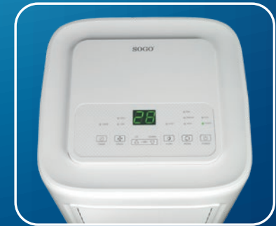
Panel de control de botones Push button control panel