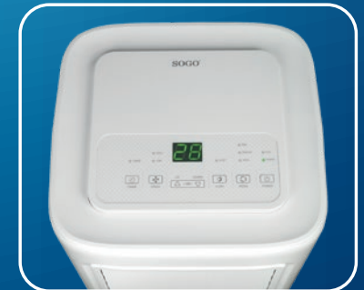
Panel de control de botones Push button control panel