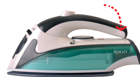
Asa Plegable Folding Handle