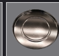
BANDEJA PARA PIZZA 30"