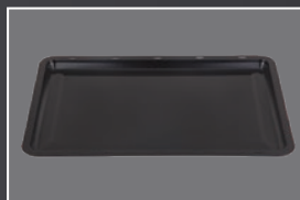
BANDEJA DE HORNO