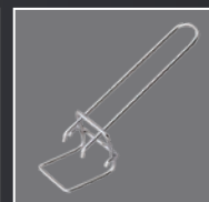
ASA DE BANDEJA