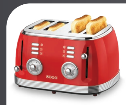
Función mecánica dual con control de ranura independiente Dual mechanical function with independent slot control Double fonction mécanique avec contrôle indépendant des fentes Função mecânica dupla com controle de slot independente Doppelte mechanische Funktion mit unabhängiger Schlitzsteuerung Doppia funzione meccanica con controllo della fessura indipendente