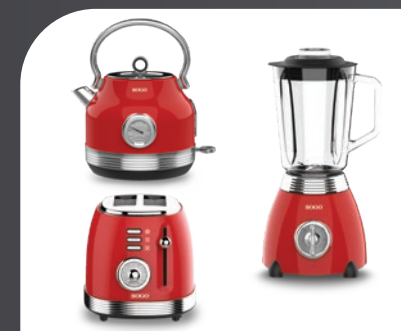
Productos Serie Retro Retro Serie products Produits de la Série Retro Produtos da Série Retro Produkte der Retro-Serie Prodotti della Serie Retro