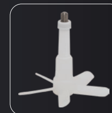
Accesorio pelador de ajo Accessoire éplucheur d'ail Knoblauchschäler Zubehör