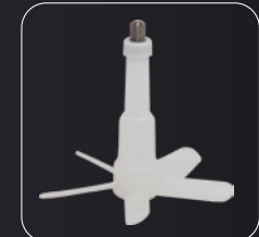
Garlic peeler accessory Acessório descascador de alho Accessorio per pelapatate