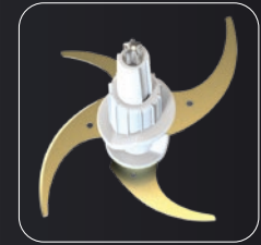
4 Titanium blades 4 Lâminas de titânio 4 Lame in titanio