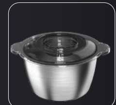
Stainless steel bowl 1.8L Tigela de aço inoxidável 1,8L Ciotola in acciaio inossidabile da 1,8L