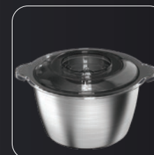
Cuenco de acero inox 1,8L Bol en acier inoxydable 1,8L 1.8L Edelstahlschüssel