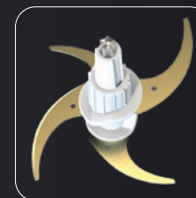
4 Cuchillas de titanio 4 Lames de titane 4 Titanklingen