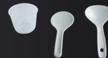
Rice spoon, Soup spoon and Measuring cup