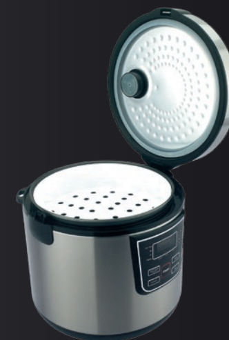
Estante de vapor