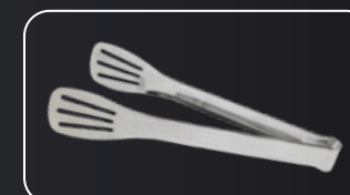
Pinza de acero inoxidable / Stainless steel tong Pinça en acier inoxydable / Tenaz de aço inoxidável Edelstahlzange / Pinza in acciaio inossidabile