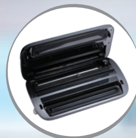
Vista abierto Open View