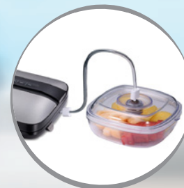
Función Canister Canister Function