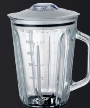
Jarra de vidrio con capacidad de 1,5L