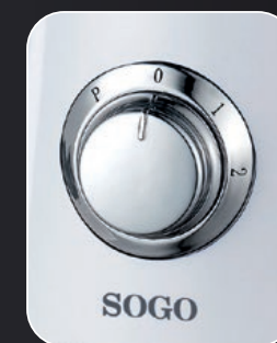
With 2 speeds: Low and high Pulse function suitable for ice crushing