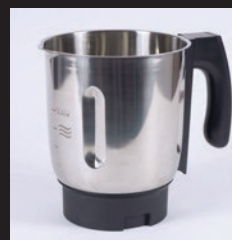
JARRA DE ACERO INOX