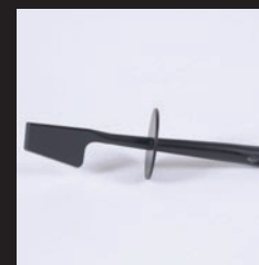
MEZCLADOR DE COMIDA