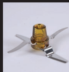
CUCHILLA ACERO INOX