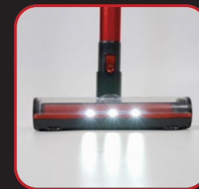
With LED indicator light