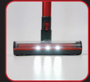
Con luz indicadora LED