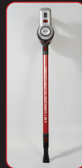
Stick vacuum cleaner