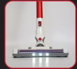
With LED indicator light