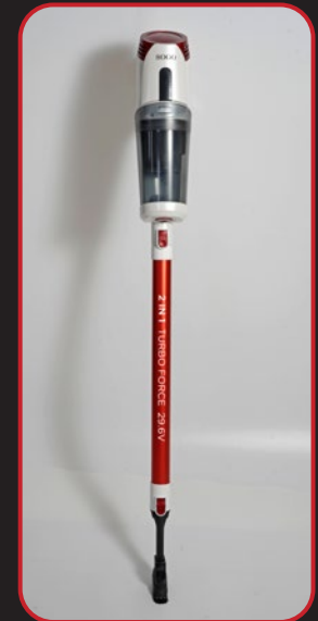
Stick vacuum cleaner