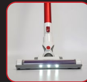
Con luz indicadora LED