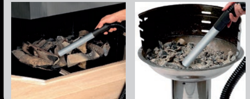
Manguera de metal flexible diámetro 38.5 mm - longitud 1m Flexible hose diameter 38.5 mm - length 1 m Mangueira flexível diâmetro 38,5 mm - comprimento 1 m