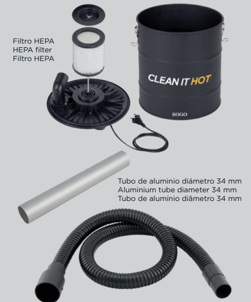
Filtro HEPA HEPA filter Filtro HEPA